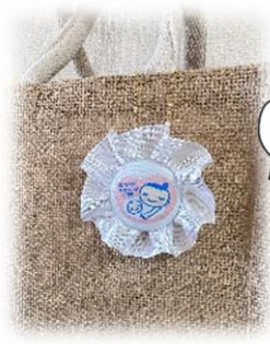
マタニティ ロゼット

妊娠期の方たちに子育て支援センターを訪れる きっかけづくりをしたいという思いから、ハンドメイド グッズを作れるイベントを開催します！ 5月11日(土) 10:00~12:00 場所: 地域子育て支援センターにこここ ※都合の良い時間にお越しいただけます