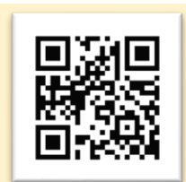
オンライン 相談はこちら